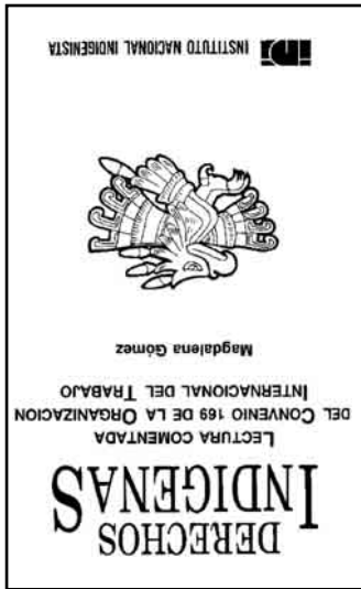
Maseualimej intechpouilimejis ten kinmanauia.

Ni Ueyi Amatlanauatli ten ika koyotlajtoli itockaj Constitución Política ipan chikuasempouali uan eyi itlanauatli (Artículo 123) kiteueua tekitinj intechpouilis. Nojki ni Amatlanauatli (Ley Federal del Trabajo) ipan chikuasen ixneixilis (Título sexto) uan chikuay iixelka (Capítulo 8) kiteueua mlajtekitl, kampa kemantika amo kintlepanitajaj intechpouilis motelakeualtiani (mlitekitinj) uan ni ten maseualimej.